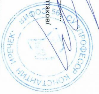
ГРАФИК ЗА ПРОВЕЖДАНЕ НА КЛАСНИ И КОНТРОЛНИ РАБОТИ