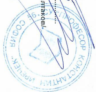
ГРАФИК ЗА ПРОВЕЖДАНЕ НА КЛАСНИ И КОНТРОЛНИ РАБОТИ