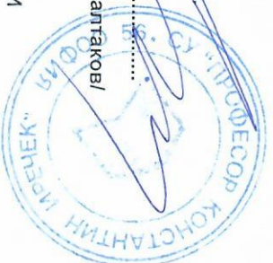
ГРАФИК ЗА ПРОВЕЖДАНЕ НА КЛАСНИ И КОНТРОЛНИ РАБОТИ

56.СУ „Професор К. Пречек“ Учебната 2025/2026 Клас: VI А