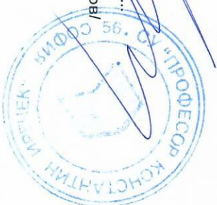
ГРАФИК ЗА ПРОВЕЖДАНЕ НА КЛАСНИ И КОНТРОЛНИ РАБОТИ