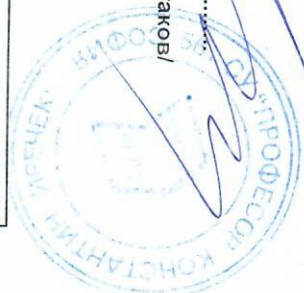
ГРАФИК ЗА ПРОВЕЖДАНЕ НА КЛАСНИ И КОНТРОЛНИ РАБОТИ