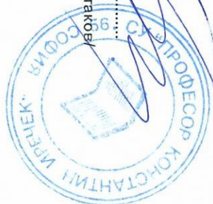
ГРАФИК ЗА ПРОВЕЖДАНЕ НА КЛАСНИ И КОНТРОЛНИ РАБОТИ