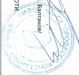
ГРАФИК ЗА ПРОВЕЖДАНЕ НА КЛАСНИ И КОНТРОЛНИ РАБОТИ